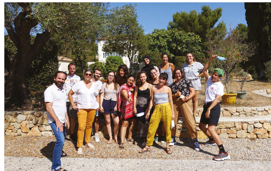
Photo de groupe à la fin du second week-end organisé par YMCA et Eurasia net.

Si l'engagement des jeunes est favorisé par la montée de projets qui lui tiennent à cœur, il est important que la structure puisse offrir tous les moyens de sa mise en œuvre , donc vérifier que celui-ci correspond bien aux ambitions et moyens de la structure encadrante au risque que les projets n'aboutissent pas ce qui décourageraient les jeunes qui s'engagent.