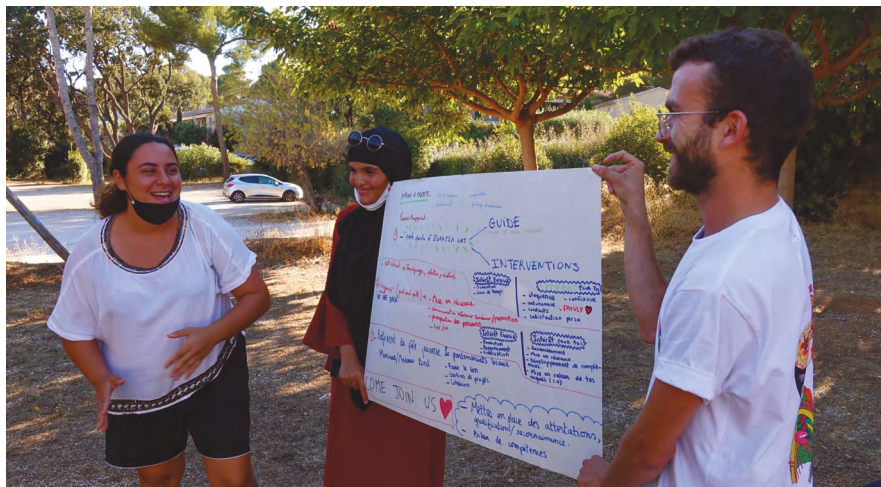
Proposition par les anciens-ne-s volontaires de nouveaux projets à mettre en œuvre au sein d'Eurasia net.

Lors de cette expérimentation, le choix a été fait d' insister sur l'aspect "réalisable" des projets, principalement en fonction du temps que les jeunes souhaitent investir dans cet engagement pour ne pas se lancer sur des projets qu'ils-elles ne seraient pas en capacité de réaliser.