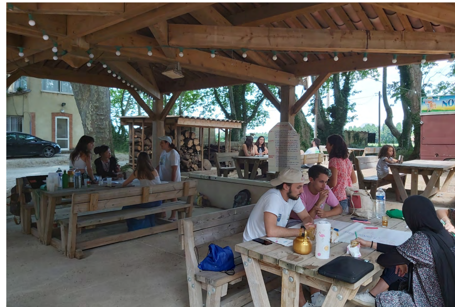
Temps de réflexion et brainstorming lors du 1er week-end à Salon de Provence.

1) Autour de ces trois grandes thématiques, imaginer dans un premier temps ses objectifs idéaux, même si un peu éloignés de la réalité des ressources d'Eurasia net, afin dans de se donner toutes les perspectives possibles ; 2) Réfléchir collectivement aux possibilités de faire coïncider ces objectifs idéaux avec les moyens réels dont dispose Eurasia net : Faire un état des lieux, un peu plus technique de l'association, revaloriser le capital, et les capacités de l'association en étant pragmatiques et réalistes, redéfinir les moyens et ressources à disposition : humains (compétences), financiers, physiques, les dispositifs et le "capital expériences" en volontariat/ innovation sociale. 3) Passer du concept à l'opérationnel, matcher les moyens avec les aspirations en s'ouvrant à de nouvelles possibilités. En bref : "comment on peut atteindre ce qu'on a identifié comme important dans le brainstorm avec les moyens dont on dispose ? Sinon, de quels moyens doit-on se doter pour y parvenir ?"